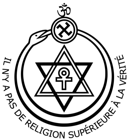
Seal of the Theosophical Society , founded 1875

Бесконечность не поддается исчислению. Яро невозможно уявить хотя бы приблизительное вычисление процесса, ибо нет начала, нет и конца, ибо конец становится началом и начало – концом Круга Вечности. Но ярый Круг, вмещающий в себя все Космические построения, Мы называем Огненным Змием. Такой Змий оявлен не только двуглавый, но уявлен на сотрудничестве с Рыбой, оявленной на раздвоенном Хвосте. Такие Аллегии уявлены от великой Древности, ибо семя мужа похоже на рыбу с раздвоенным хвостом, но выделения матки – на Змия с раздвоенной головой. Такой Змий оявлен на поглощении Рыбы, но такое поглощение оявляется на размножении миллиардов таких рыб. Такое множество рыб в каждом Луче Солнца.