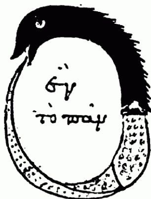
Early alchemical ouroboros illustration with the words ἓν τὸ πᾶν ("The All is One ") from the work of Cleopatra the Alchemist in MS Marciana gr. Z. 299. (10th century).